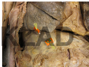
10 – right diaphragmatic pleura 11 – right costal part of diaphragm