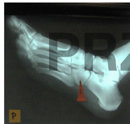
2 – right cuboid bone